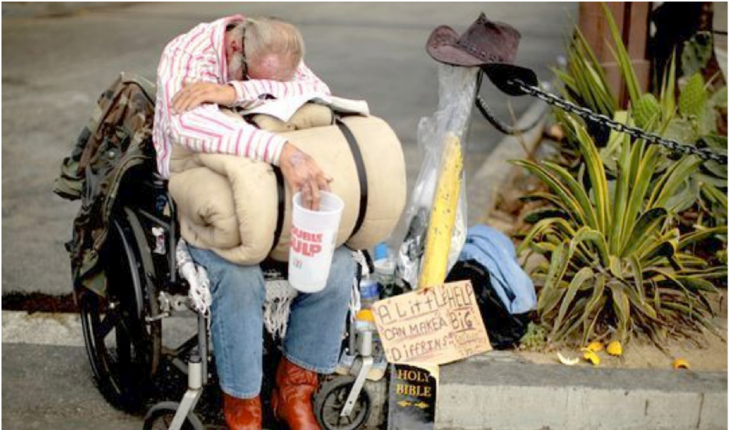
Obdachloser in Los Angeles