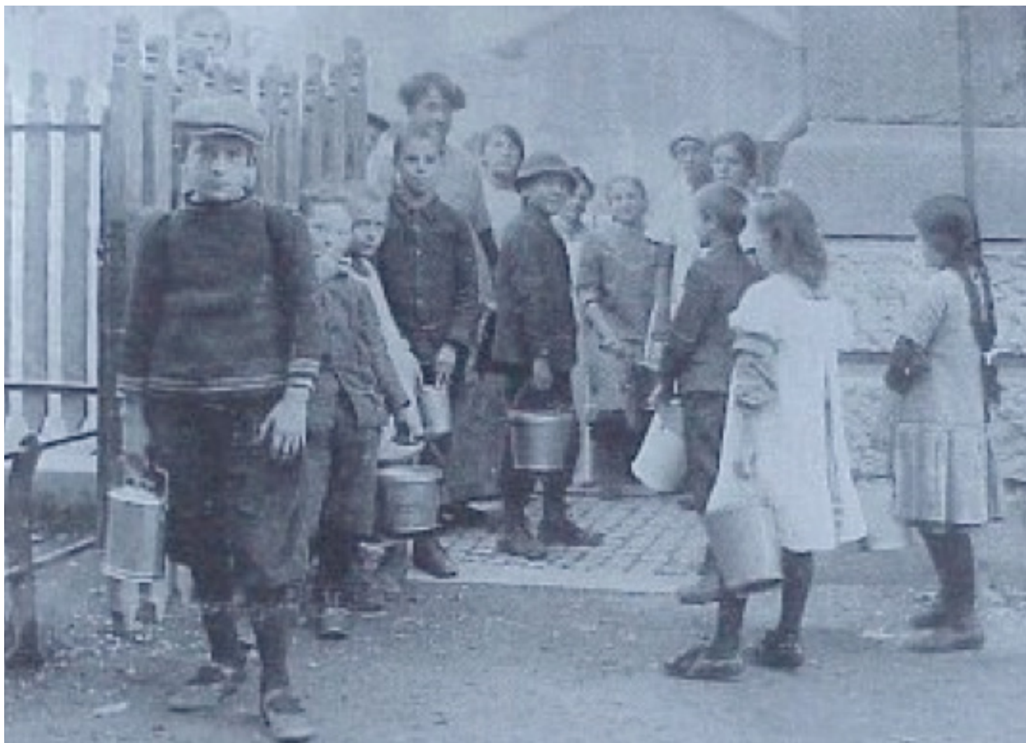
Suppenküche in Aussersihl, 1917

Undifferenzierte Schuldzuweisungen gegenüber Armutsbetroffenen stellen die erzielten Fortschritte bei der Bekämpfung der Armut in Frage. Setzt sich die populistische Rechte unter Führung der SVP mit ihren Vorstellungen durch, ist es vorbei mit der Rechtsgleichheit in der Sozialhilfe. Sozialhilfeempfänger/-innen werden dann abhängig sein vom Wohlwollen von überforderten Laienbehörden, die unter Spardruck stehen. Sie werden im schlimmsten Fall aus ihren Wohngemeinden vertrieben und ihrer Würde beraubt. Armut wird im öffentlichen Raum wieder stärker präsent – in Form von Obdachlosigkeit, bettelnden Kindern oder Kleinkriminalität.